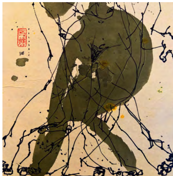
Exemple de dessin à l'encre 25 x 25 cm proposé en souscription avec le livre pour 180€ (voir au verso).