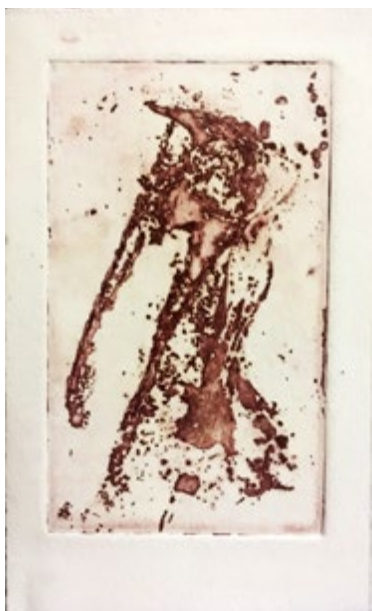
Gravure 13 x 8 cm