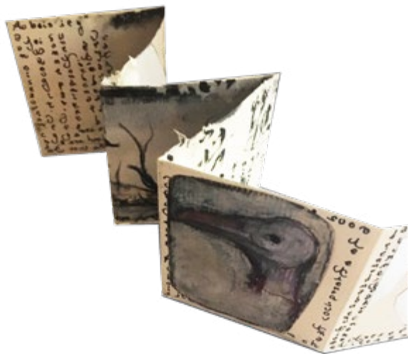
Leporello 10 x 50 cm