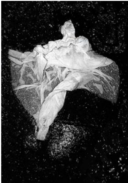
Papier de nuit n°1