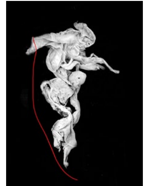
Lien rouge n°2