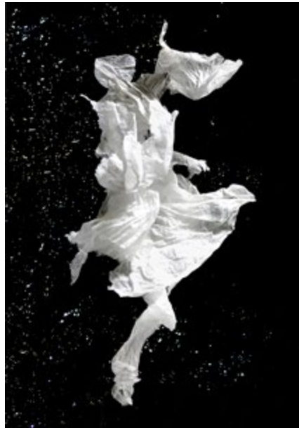
Papier de nuit n°2