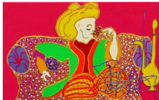
Le Prince Gourmand

Le catalogue réalisé en juin dernier par L'œil de la femme à barbe pour le 1er épisode de l'exposition est à consulter en ligne sur Calameo.com