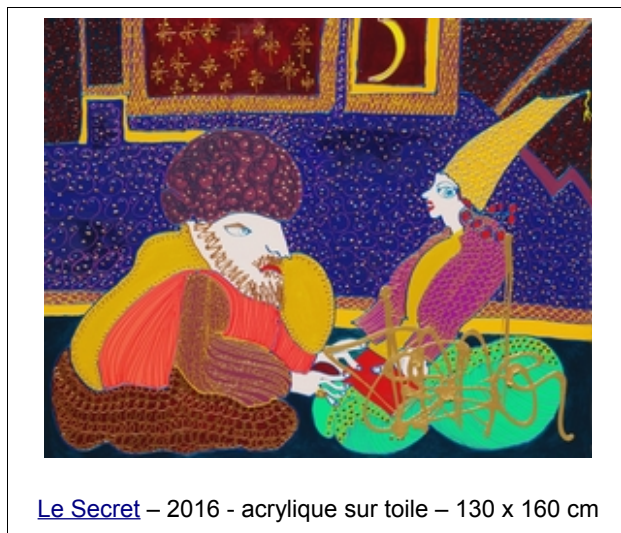
Le Secret – 2016 - acrylique sur toile – 130 x 160 cm