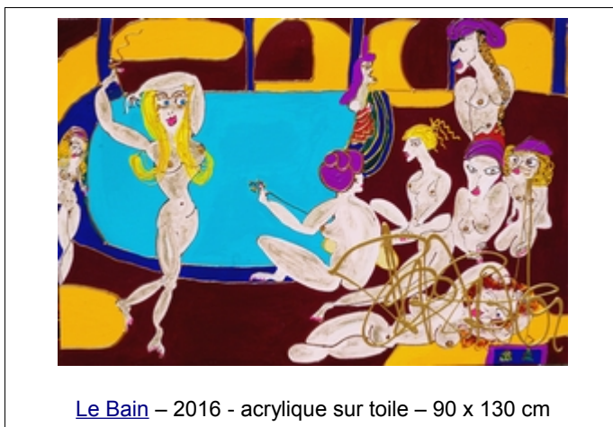
Le Bain – 2016 - acrylique sur toile – 90 x 130 cm

Contactez Ghislaine Verdier par mail : lafemme@loeilabarbe.fr • par téléphone : 06 81 22 16 87 Retrouver l'actualité de L'œil de la femme à barbe : http://loeildelafemmeabarbe.fr