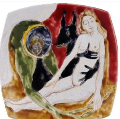
Sophie Sainrapt peinture - dessin