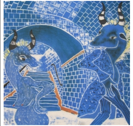
Nicole Pavlowski peinture – sculpture - céramique