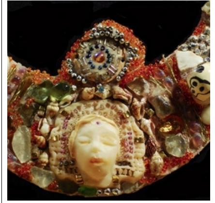
Frédérique Jacquemin sculpture - bijoux