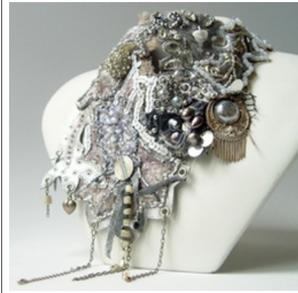
Emilie Chaix sculpture - art textile