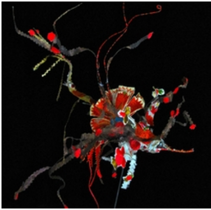
Rébecca Campeau art textile- bijoux