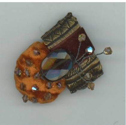
Hélène Lagnieu dessin - bijoux