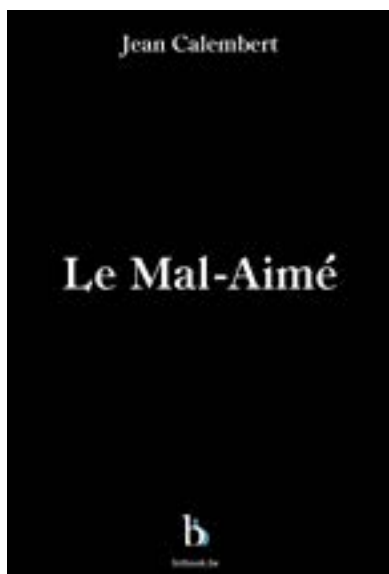
Le Mal-Aimé , roman - 224 pages 2022 - Éditeur bitbook.be