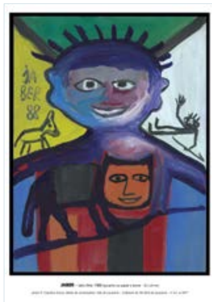
Tirage numérique 42 x 29,7 cm Collection de l'Art Brut de Lausanne